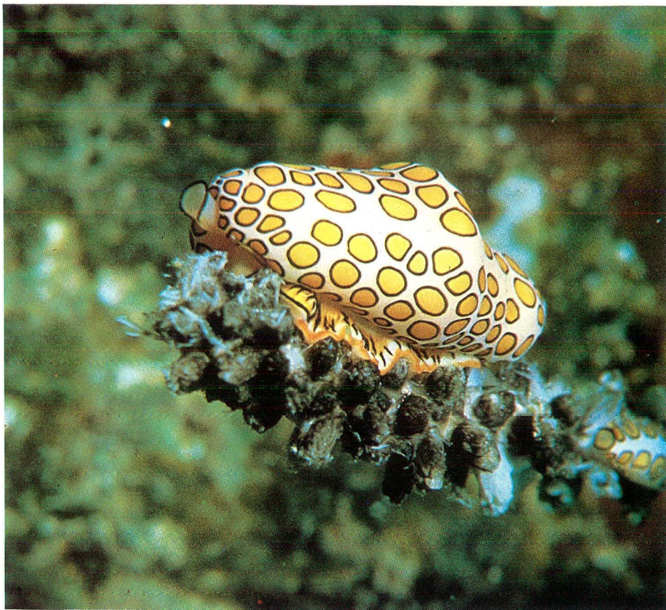
Afb. 1 Cyphoma gibbosum , gefotografeerd door Angelika Honsbeek ten zuiden van het Cubaanse eiland Isla de Juventud.

Cyphoma gibbosum is een van de soorten van het geslacht Cyphoma Röding, 1798, welk geslacht via de onderfamilie Simniinae Schilder, 1927 deel uitmaakt van de familie Ovulidae Fleming, 1822. De leden van deze familie tonen verwantschap met de Cypraeidae. Beide families vinden dan ook onder-