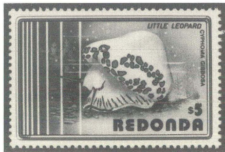
Afb. 3 Afbeelding van 'little leopard' op een postzegel van Redonda.