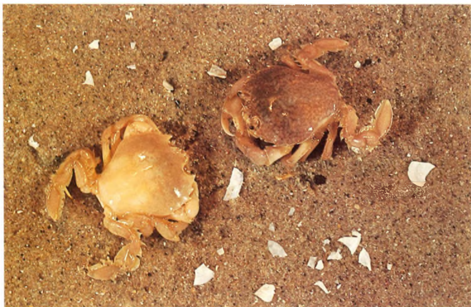
Afb. 1 Twee breedpootkrabben, Portumnus latipes (Pennant) op het strand.

Mocht uw vakantiebestemming een wat zuidelijker kust aanwijzen, dan blijft een ontmoeting moge-