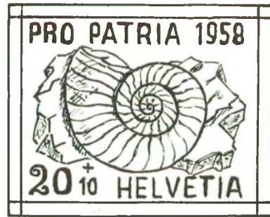
Afb. 1. Ammoniet.