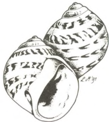
Lunatia alderi (Forbes), naar de natuur getekend door Leo Man in't Veld, 3 x ware grootte.

Opmerkelijk is dat ons het afgelopen jaar nog meer meldingen van levende Glanzende Tepelhoorns op het Nederlandse strand ter oren kwamen. Wellicht is dit fraaie soortje weer in opmars. (Red.)