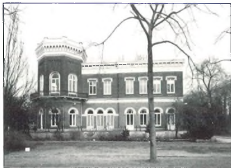
Villa Dijkzicht, waarin thans het Natuurmuseum Rotterdam is gevestigd.