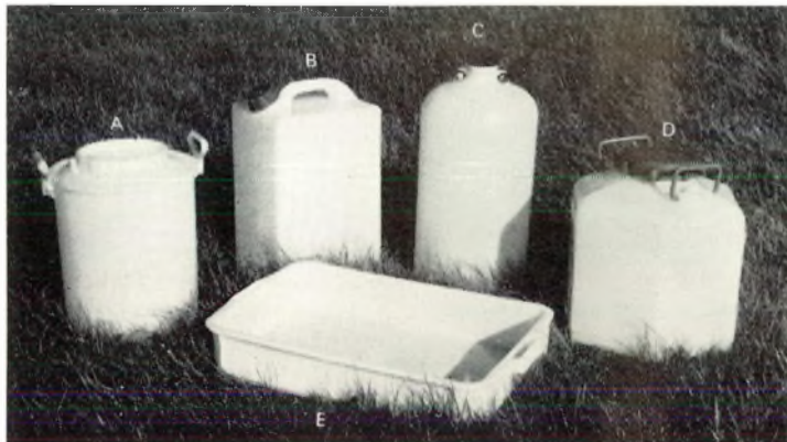
Afb. 3. Verklaringen in de tekst.