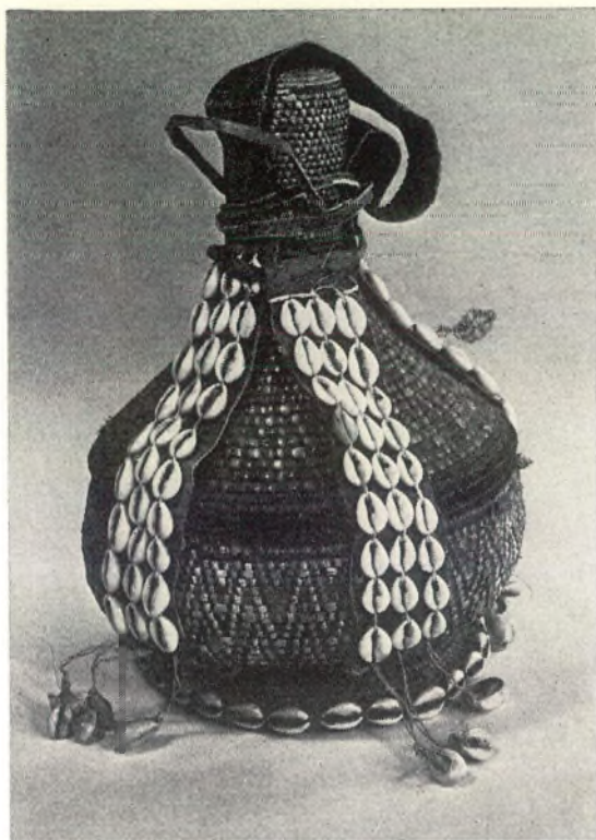
Afb. 2 Gevlochten mandje met leer Ethiopië, Afrika. Hoogte ongeveer 30 cm.

dunne reepjes leer, die elk een kauri dragen. De kauri's zijn met een bruinig touw op het leer vastgenaaid. De kauri's zijn aan de „rugzijde” afgeslepen en met de mondopening naar boven bevestigd. In het museum van Land en Volkenkunde in Leiden kende men dit sierraad niet en ook in de literatuur ben ik nergens een afbeelding tegen gekomen.