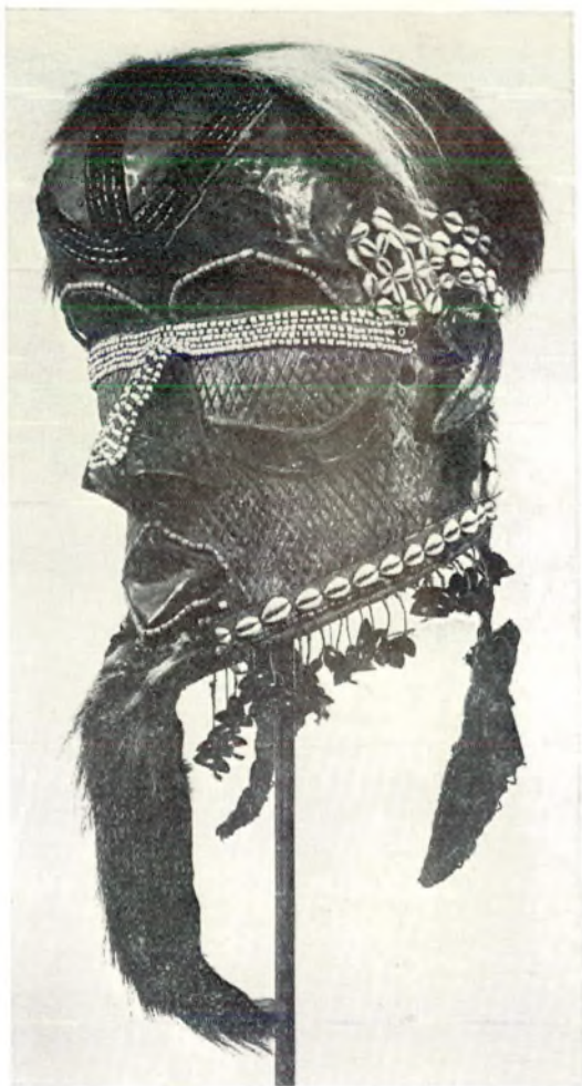
Afb. 3 Stulpmasker van de Makubastam, Kongo, Afrika. Materiaal: hout, koper, schelpen, huid en kralen. Hoogte ongeveer 50 cm.

is een stuk huid van één of ander roofdier bevestigd. Onder aan het masker bungelen gehalveerde bruine zaden aan touwtjes. Twee typische, driehoekige ahangsels van rode stof met simpel naaldwerk versierd hangen aan weerszijden van het grote masker. In de literatuur over Afrikaanse volkskunst komen we dit masker, vaak met kleine variaties vaker tegen. Van de Makuba stam is bekend dat zij een grote kunstzinnige inslag bezit. Al met al drie fraaie stukken, die een waardevolle uitbreiding van de museumcollectie betekenen. Plaatsgebrek maakt het ons niet mogelijk de drie ethnografica nu te exposeren. Straks in het nieuwe museum zeker wel. Vraagt u er echter toch maar naar tijdens een bezoek aan het huidige museum.